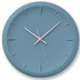
RF22-06 BL ブルー 4515030100638