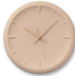
RF22-06 BG ベージュ 4515030100645