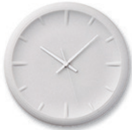
RF22-06 WH ホワイト 4515030100621

RELIEFは、すり鉢状にくぼんだ中央面にレリーフのように指標が浮かび上がり、その彫刻的な美しい陰影により時を知らせる壁掛け時計です。外側のフレーム部分は柔らかな丸みを帯びており、壁に優雅な影を落とします。掛け時計という差別化が難しいジャンルにおいて、基本機能を満たしながら、ミニマルかつ形状に新規性を持たせ新しい時計のかたちを表現しています。天然素材である磁器と、セラミックジャパンによる高度なやきものの技術を用いて歪みのない繊細な形状と陰影を際立たせるマットな質感を実現しました。その外観はモダンなインテリアに調和し、空間の質と時計の価値を高めます。